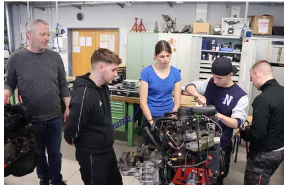
Kfz-Technik: Fehlersuche am Auto