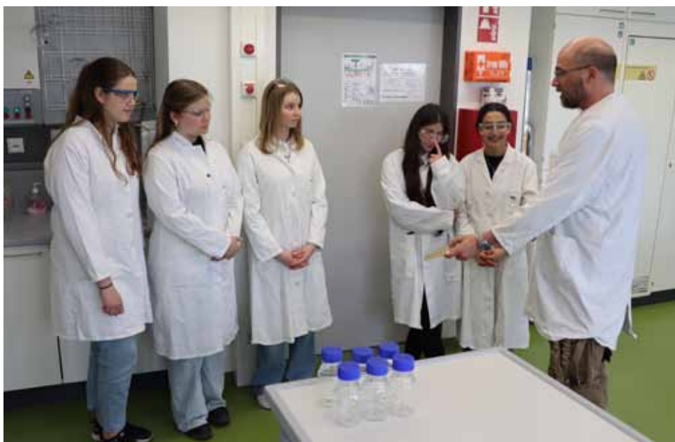
Naturwissenschaften: Arbeiten im Chemielabor