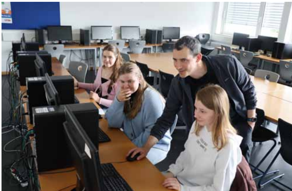
Gestaltungs- und Medientechnik: 3D-Programm und 3D-Drucker