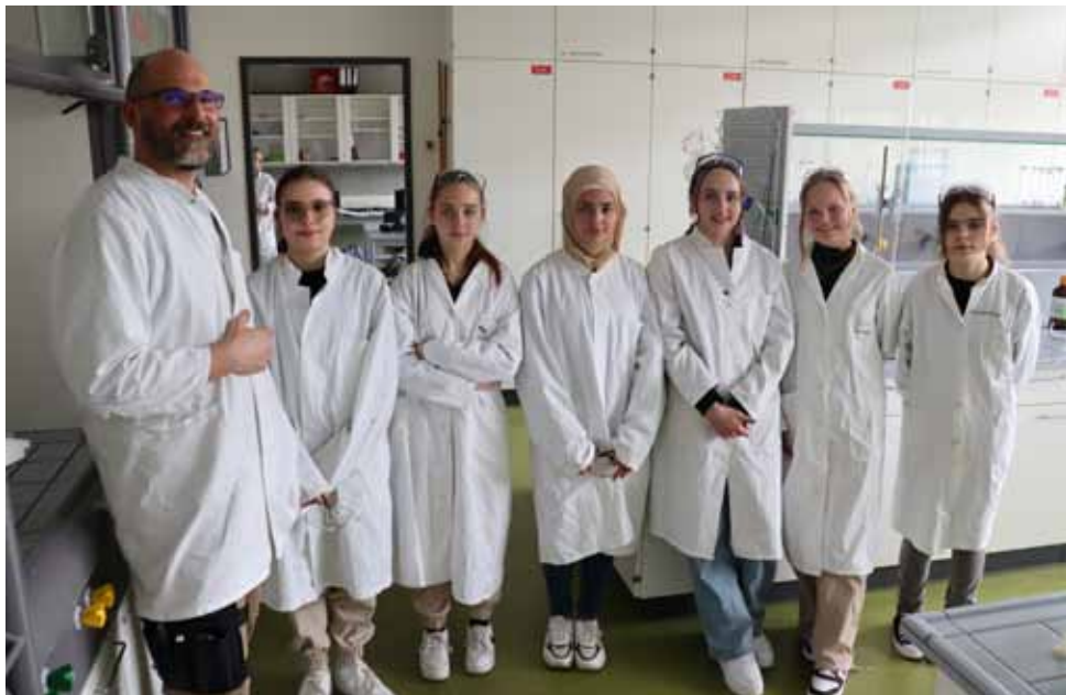
Naturwissenschaften: Arbeiten im Chemielabor